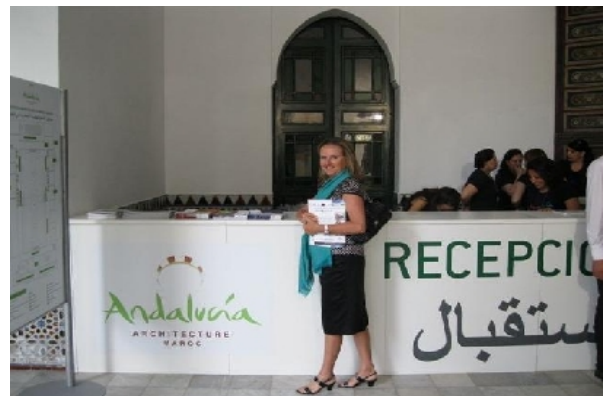
Directora We-Equip/We-Design en Tanger

El pasado mes de Junio CITMA organizó la "Jornada de encuentro de arquitectos" en Tánger, Marruecos. Company We participó con mucho éxito en dicho evento con el fin de estrechar relaciones y colaboraciones con nuestro país vecino.